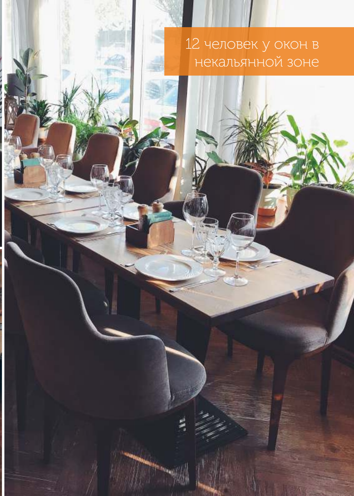
12 человек у окон в некальянной зоне