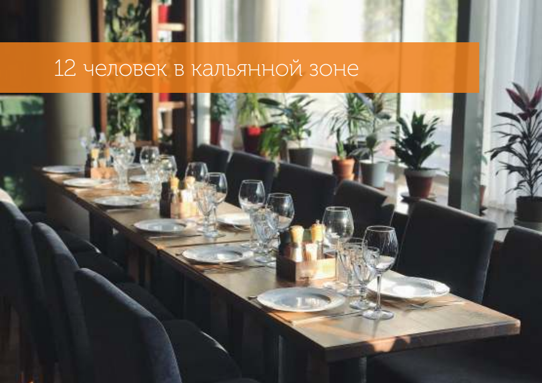
12 человек в кальянной зоне